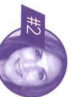
Nora BERRA Grand Lyon Médecin, Ancienne Ministre, Ancienne Députée européenne, Conseillère régionale, Conseillère municipale et métropolitaine de Lyon.