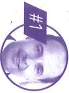
Jean-Christophe LAGARDE Seine-Saint-Denis Député. Ancien Maire de Drancy.