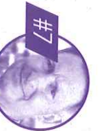
Florent MONTILLOT Loiret Expert en sécurité publique, Conseiller régional, Maire-adjoint d'Orléans.