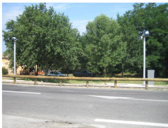
Sortie de tronçon