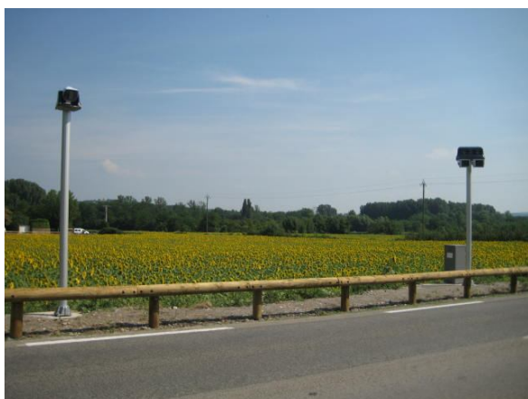
Entrée de tronçon