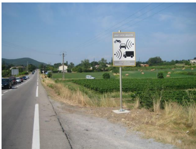
Panneau de présignalisation