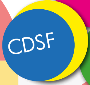
Schéma départemental des services aux familles de l'Ardèche 2021 – 2026