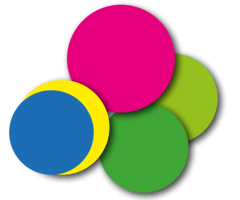
SCHÉMA DÉPARTEMENTAL DES SERVICES AUX FAMILLES DE L'ARDÈCHE