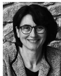
Olivier KLEIN Ministre délégué de la Ville et du Logement