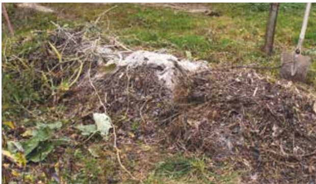
Le compostage en tas est pratique si vous disposez de place mais de peu de temps à y consacrer.