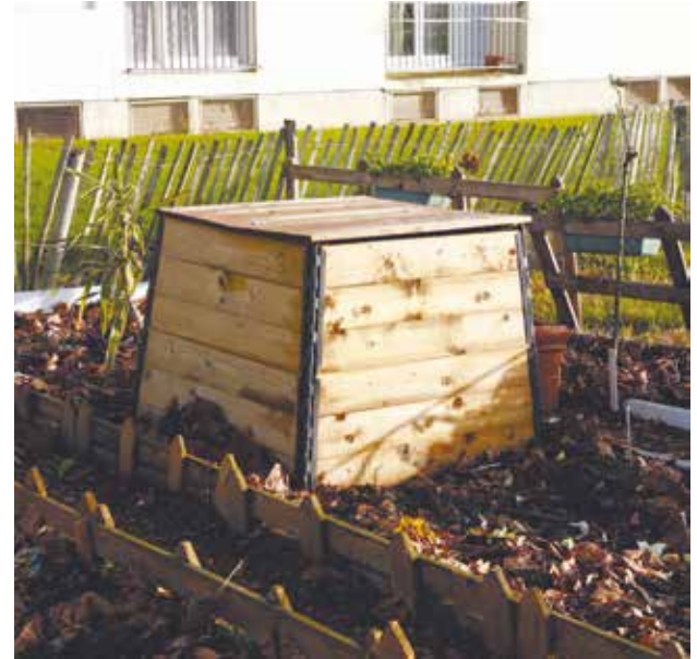
La pratique du compostage partagé se développe de plus en plus.

Dans votre immeuble, votre résidence ou votre quartier; parlez-en autour de vous pour savoir si des habitants voudraient participer; mobilisez vos voisins, c'est un des gages de réussite d'une telle opération.