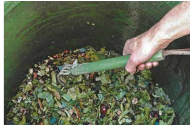
Le brassage des déchets est une des conditions de la réussite d'un compost.

réaliser un brassage régulier (notamment au début du compostage lorsque l'activité des micro-organismes est la plus forte, puis tous les 1 à 2 mois). Le brassage permet de décompacter le compost, de l'aérer et d'assurer une transformation régulière .