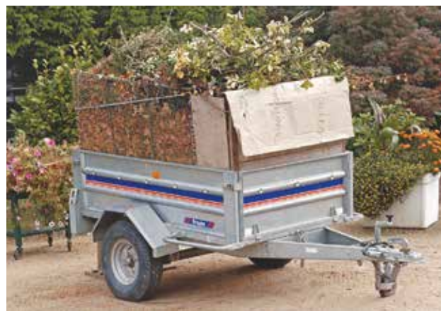
Réduire la production de déchets verts et les utiliser pour pailler votre jardin ou fabriquer du compost vous évite des déplacements en déchèterie.

en jouant sur des techniques de jardinage : moins d'engrais et d'arrosages pour limiter la croissance des plantes ; tontes, feuilles et brindilles laissées sur place ; diminution du nombre de tontes (mise en place de prairies fleuries, tontes sur certaines zones du jardin seulement...).