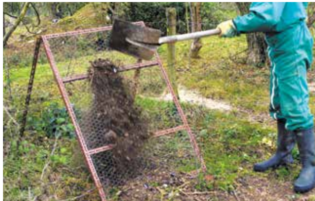
Pour tamiser, un simple grillage posé sur un cadre peut faire l'affaire.

Le tamisage permet d' affiner le compost et de l'utiliser plus facilement . Il permet d'éliminer les éléments grossiers qui n'ont pas été complètement transformés.