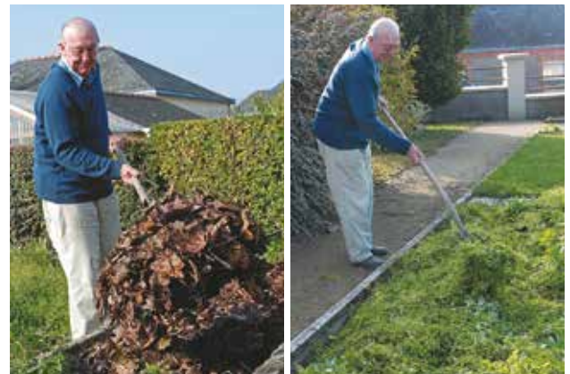
Il est possible de pailler avec des feuilles mortes ou des herbes fraîches.

des salissures, pour les fruits et légumes (paillage des fraisiers...).