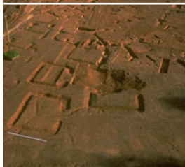
Bibracte, vue de la nécropole de la Croix du Rebut, Tène finale-époque augustéenne, 1998 / cliché Bibracte/A. Maillier