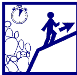
Gagnez un point en hauteur