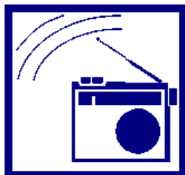
Ecoutez la radio ( France Bleu Drôme-Ardèche) et respectez les consignes des autorités, gardez votre calme