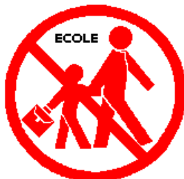
N'allez pas chercher vos enfants à l'école : l'école s'occupe d'eux