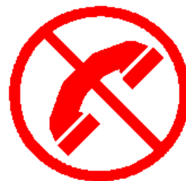
Ne téléphonez pas : libérez les lignes pour les secours