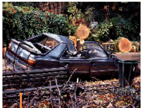
Dégâts générés par un orage