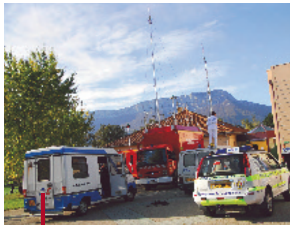
Postes de commandement des services lors d'un exercice

Dans ce cas, il doit exister un contact entre l'animation et ces acteurs extérieurs au P.C.C. pour garantir la cohérence de l'exercice