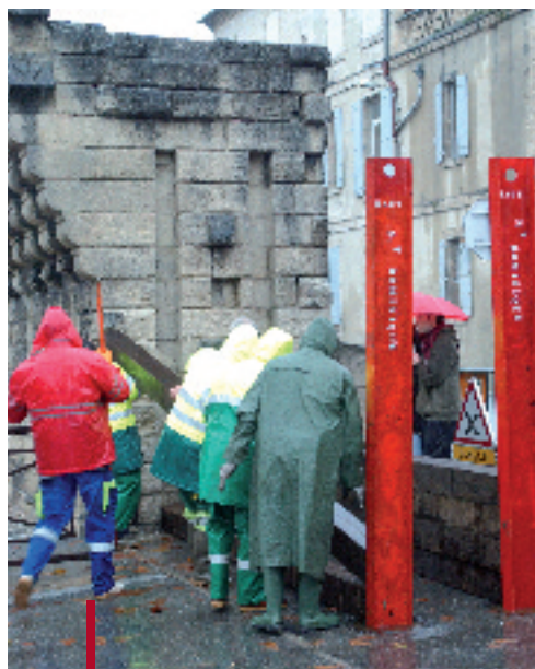
Test de mise en place de batardeaux

Ces tests, s'ils sont effectués de façon régulière, permettent de garantir la fiabilité des outils et d'acquérir les réflexes nécessaires. La notion de délai de mise en œuvre est essentielle dans ce type d'exercice.