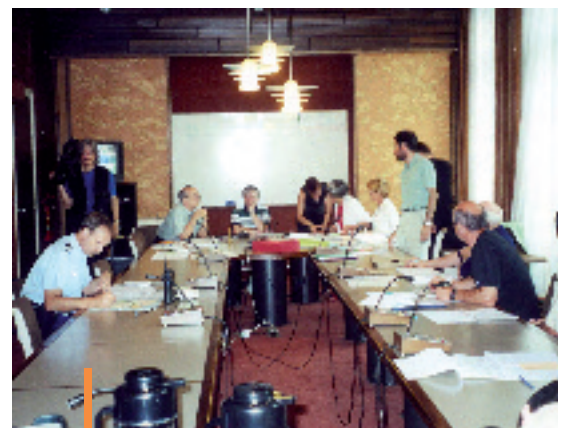
Exercice partiel faisant jouer le poste de commandement communal