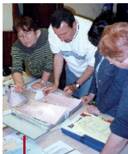
Une organisation simple, les études de cas