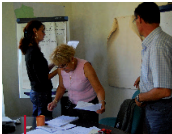
"Exercice de cadres simple" pour entraîner les membres du P.C.C.